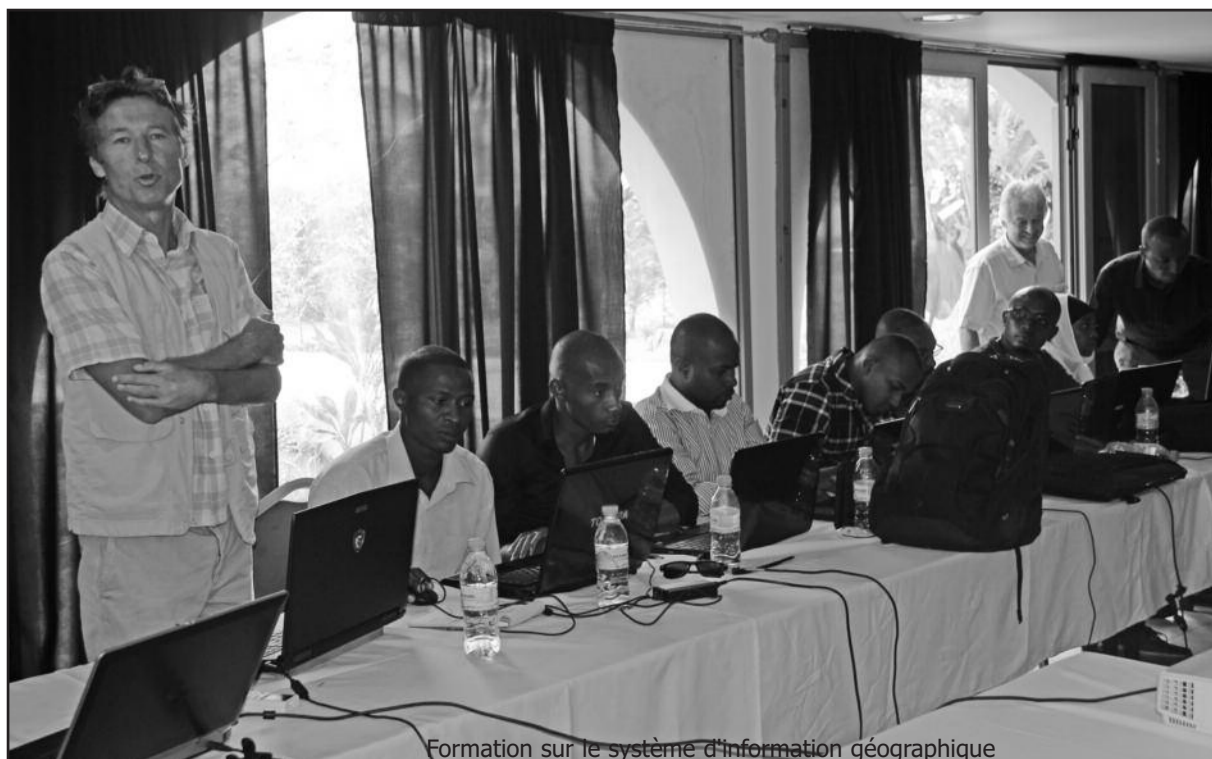
Formation sur le système d'information géographique