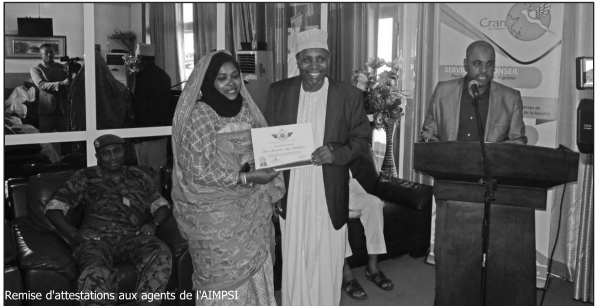
Remise d'attestations aux agents de l'AIMPSI

L'analyse des écarts est une étape cruciale dans le processus de certification. Une étape où l'on remet tout en cause notamment nos certitudes, une phase où on apprend réellement où nous en sommes pour nous orienter vers la mise en œuvre des actions les plus judicieuses pour répondre aux exigences. À partir de cette analyse, l'Aimpsi pourra aisément