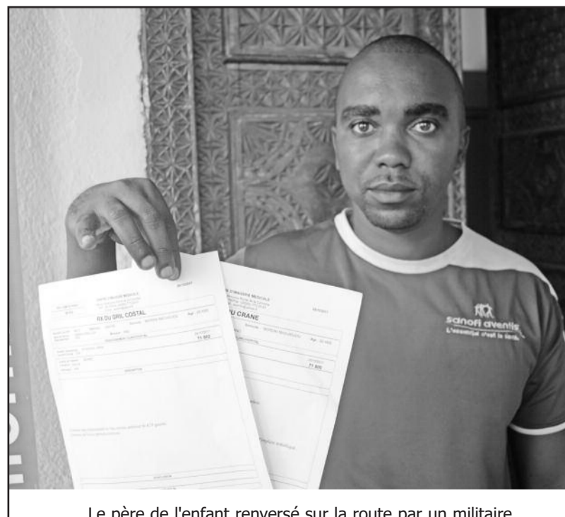
Le père de l'enfant renversé sur la route par un militaire