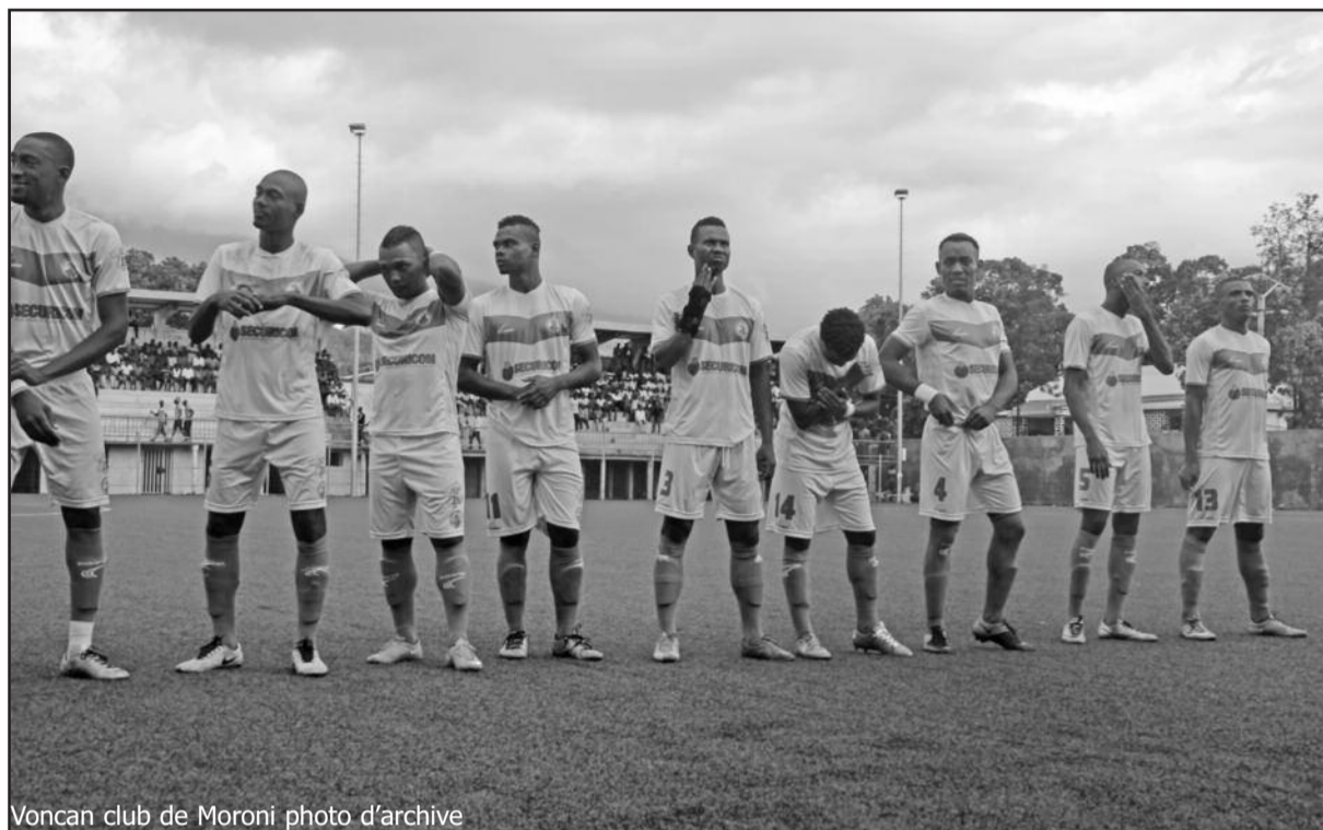
Voncan club de Moroni

Volcan club de Moroni (43 points, +20) Bonbon Djema de Moroni (43, +19) Elan club de Mitsoudje (39, +17) Jacm de Mitsoudje (37, +10) Ngaya club de Mde (31, +6) Enfants des Comores (27, +1) Étoile du sud (26, +1) Asceji d'Ipvembeni (25, +0) Apache club de Mitsamiouli (22, -12) Coin nord de Mitsamiouli (20, -4) Alizée fort de Salimani-Hanmbu (17, -21) Fc Hantsindzi (12, -23)