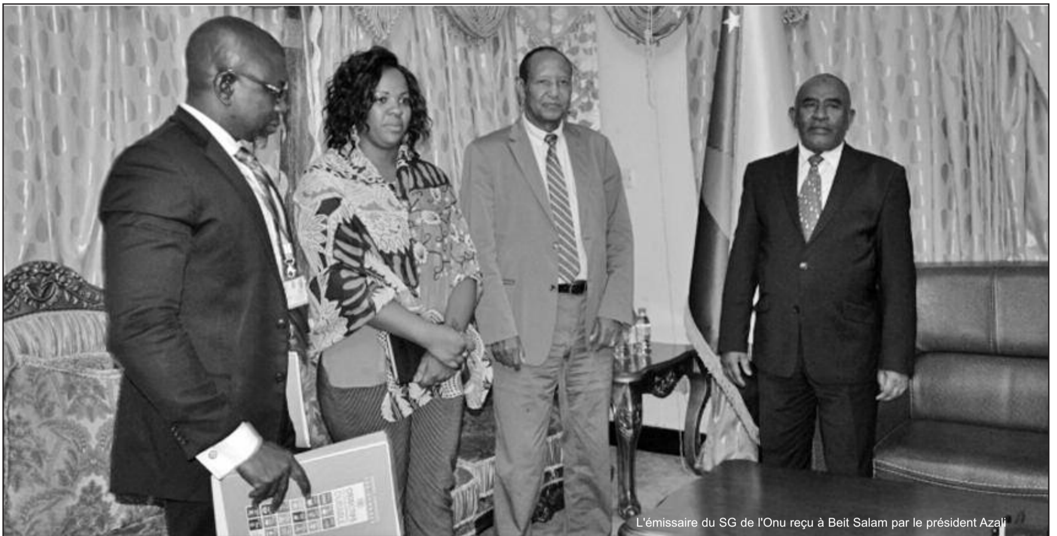
L'émissaire du SG de l'Onu reçu à Beit Salam par le président Azali