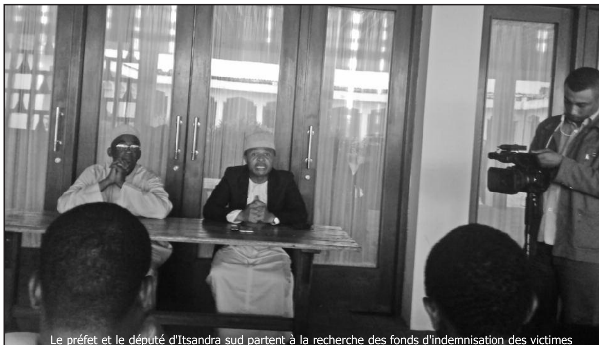
Le préfet et le député d'Itsandra sud partent à la recherche des fonds d'indemnisation des victimes